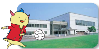
@敦賀市総合運動公園体育館