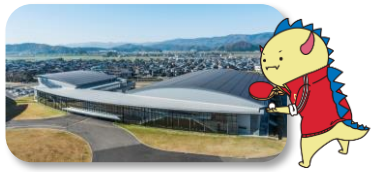
@福井市/福井県営体育館