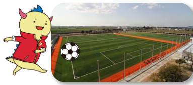
@坂井市/日東シンコースタジアム丸岡