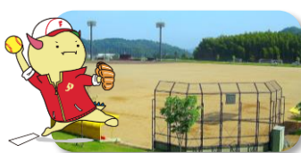
@敦賀市/きらめきスタジアム