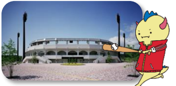
@福井市/フェニックススタジアム