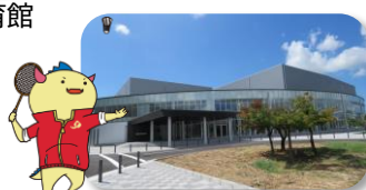
@越前市アイシンスポーツアリーナ