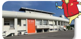
@福井市/福井県営陸上競技場(9.98スタジアム)