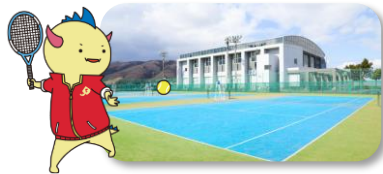
@福井市/わかばテニスコート