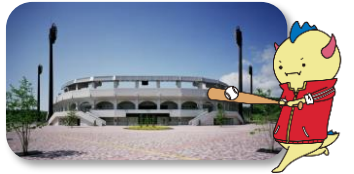
@福井市/フェニックススタジアム