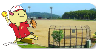
@敦賀市/きらめきスタジアム