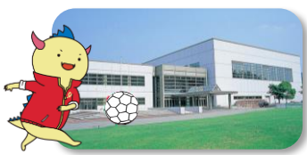
@敦賀市総合運動公園体育館