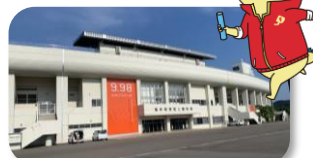
@福井市/福井県営陸上競技場 (9.98スタジアム)