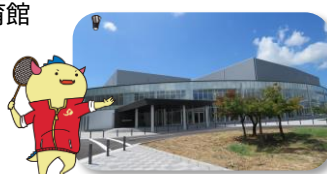
@越前市アイシンスポーツアリーナ