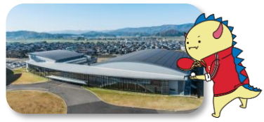
@福井市/福井県営体育館