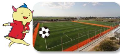
@坂井市/日東シンコースタジアム丸岡