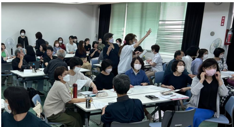
大会実行委員会の様子 福井県社会福祉センター