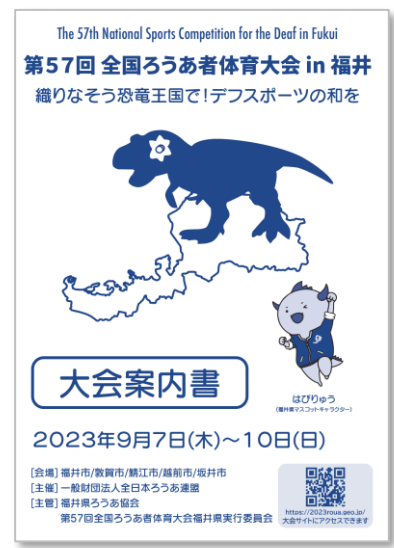
完成した大会案内書