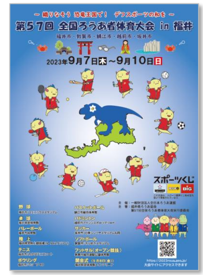
完成した大会ポスター

この度、案内書と大会ポスターが完成しました。大会ポスターは、すでに発送済、案内書は来週中に発送いたします。ご確認いただき、お申込みいただけますよう、よろしくお願ひします。 全国のみなさん、こんにちは。今シーズンは、全国ブロック単位の体育大会が、日頃の練習成果を発揮し、各競技が繰り広げられていることと思います。 全国ろうあ者体育大会に一堂に集まり、選手の皆さんが十分に競技できるように、いろいろな準備を進めております。