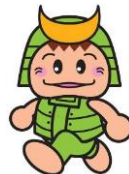
ツナガくん (敦賀市公認キャラクター)