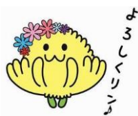
きくりん (たけふ菊人形のマスコットキャラクター)